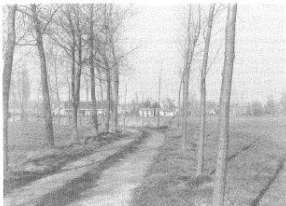
In het Oudenakkerstraatje, ter hoogte van nr. 14 : land, den hoekakker. De toren van Eksaardekerk : midden op de achtergrond.

De teksten geven doorheen de jaren dus behoorlijk wat continuïteit in de houders of de mannen afhange van dit leen, hoofddeel Oudenakker.